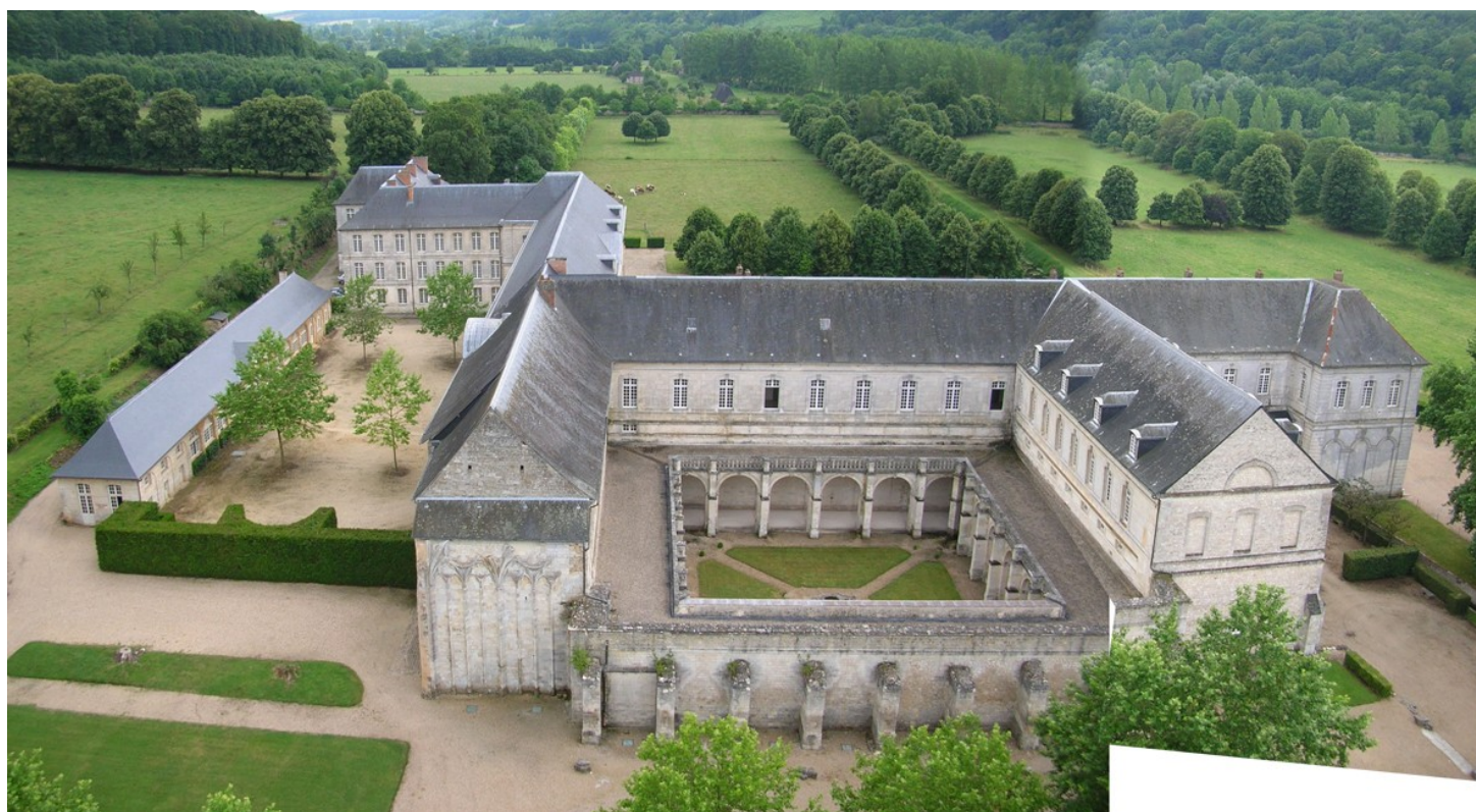
Vue de l'abbaye depuis la tour Saint-Nicolas. 2010.

1979 – 1984 : Aménagement de l'ancien cellier en bibliothèque.