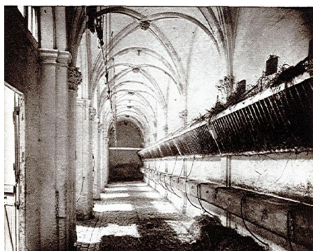
Le cloître vers 1927.

1945 : Cession de l'abbaye au ministère de l'éducation nationale, service des monuments historiques.