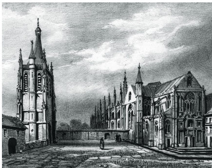
Église abbatiale et tour Saint-Nicolas. Lithographie de Nicétas Périaux. XIX ème siècle.

1419 – 1450 : Réparation de l'abbaye en ruine.