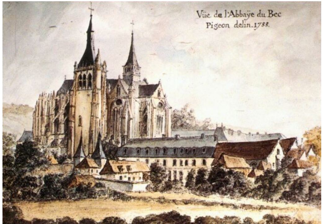
Vue de l'abbaye. 1788.

1490 : Construction de la grande porte de l'abbaye.